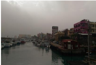
小琉球港口一隅(日出前)